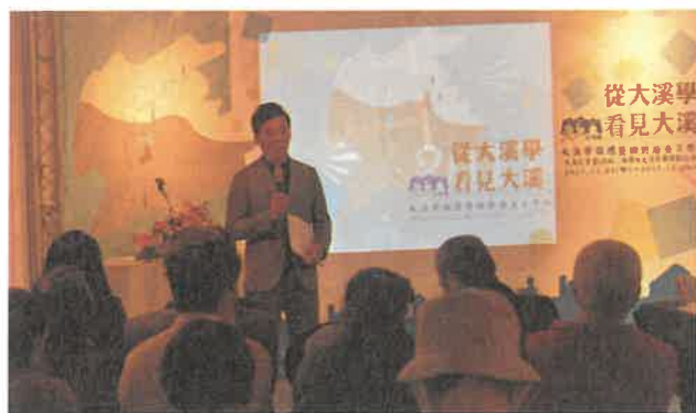
筆者協助籌畫 2016 年大溪學系列活動