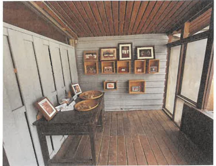
三和木藝街角館的照片與文物展覽

許多博物館雖然有在地協作機制，透過補助或輔導方式，與地方的社團、學校或個人合作，但較常見到的方式是僅以經費補助，或是博物館主導、地方配合執行。大體而言仍處於上對下的互動關係，若非博物館支配地方的形式，則常流於自由放任方式，往往無法以館所培力在地過程中建立住民自主性的問責制度。木博館開館以來以「共學」機制作為館方與在地住民互動方式，館員擁有學術知