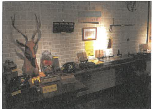
達文西瓜藝文館街角館設立展覽展示大溪文化