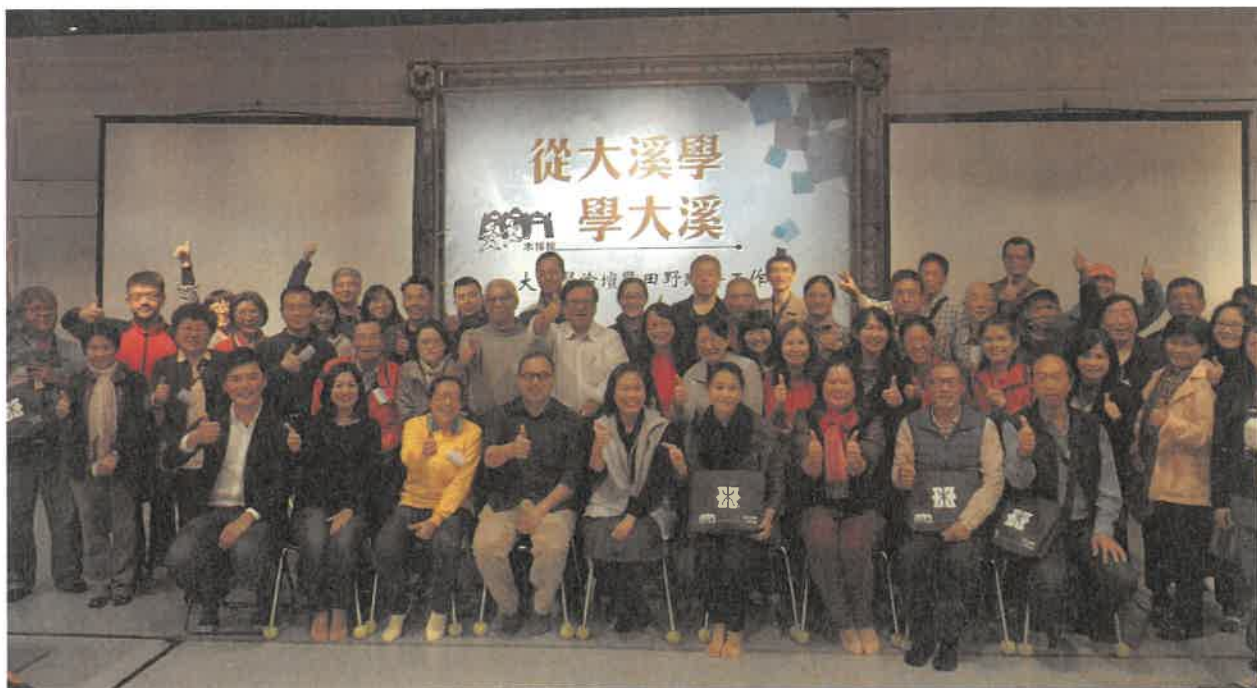
2016 年大溪學系列活動