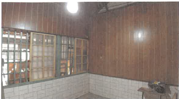
修復前的「南門壹陸」舊屋力建築內部情景

如同大溪街角館般除了整修傳統街屋並活化為文化據點，還加入嘉義市區的國小、在地文化團體、外縣市文化局等來此地交流或舉辦文化活動，在巷弄中已建構社區的文化保存據點，也確實以博物館思維投入在地文化與教育的扎根行動。未來期待持續強化在地文化意識，串聯學校與社團機構，建構地方文化發展平臺，並且以文化治理的思維浸潤社區。