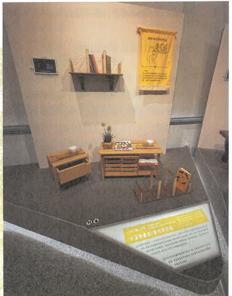
三和木藝街角館於「打開木世界」特展的展示區