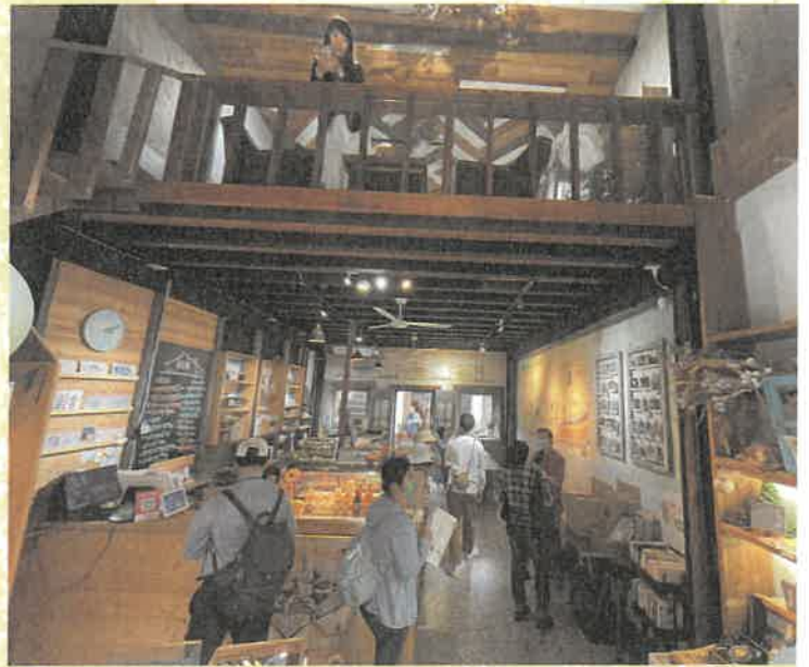
新南一二街角館經營融入中山路老街營造

絕大部分的博物館欠缺足夠人力與經費，多數無法確實透過博物館經營影響廣大的地方發展。自2017年起街角館開始強化區域串聯，透過傳統街區、農村、休閒農業區內街角館的合作，或是單一街角館對社區的資源串聯，形成街角館的協作平臺。前者如大溪老城區（小徒弟拜師學藝等活動）、河西地區（以日日田街角館為主）、康莊休閒農業區的串聯（三和木藝街角館為主）等，後者如大房豆干的美食地圖、新南一二的老街串聯等，近年來街角館自主成為社區發展的平臺，不須透過木博館即可影響地方發展。社區營造動力學如同腳踏車般，起步通常是吃力且不穩，但上路後車輪可自行前進時，只需伴隨路程不同狀況給予適當「推力」，即可讓住民參與的機制持續運轉。當住