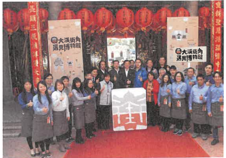
2016年大溪街角館長榮譽授證典禮

當在地民眾有意願推動大溪地方文化發展，而申請街角館補助申請時，應提出具體經營空間或其他與大溪歷史文化有關場域，必須非一時性的空間建構，並具有永續經營之意願。街角館所建構的空間應開放公眾參觀，除了提供具有文化公共性的體驗空間，也必須配合木博館推動文化活動，以及最後的成果展示與教育推廣（陳倩慧，2019a，2019b）。大溪街角館於2021年38間的街角館中 1 ，有14間位於大溪老城區，其餘則分散於大溪周遭的郊區與農村，透過散布整體大溪的街角館群來促成大溪就是一座博物館的理念。