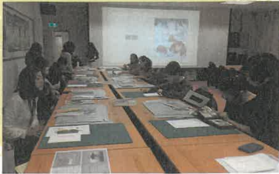
街角館文物典藏培訓課程（無酸卡紙相框實作）

識、博物館專業、行政能力，百工百業的住民則擁有地方知識，透過館方與住民相互學習達成共同願景，讓館員提升地方知識而住民可學習多元專業知識。透過共學機制下，更能賦權住民執行更關鍵且重要的博物館事務，讓住民肩負適當的地方發展責任，如此住民與館方的合作就不會僅流於被動配合。