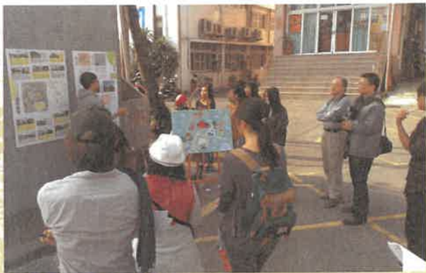
2017年「斗六舊城街角館」行動計畫策展與導覽