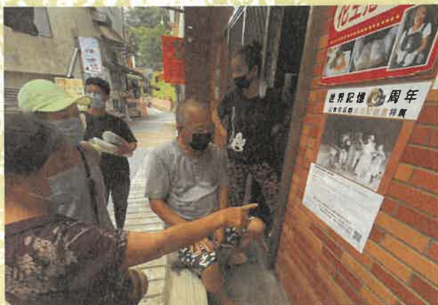
山本作兵衛世界記憶十周年特展於平溪老街展區展出

木博館的住民參與式文化治理越趨受到各界矚目，大溪區的公共建設與活動皆扣合木博館的整體發展，從公有館區域的都市與交通計畫、休閒農業區、宗教活動等，以博物館專業作為大溪文化治理的策略已大抵確認（黃蘭燕，2016）。以下以木博館的街角館計畫為主要案例，探討住民參與機制與社區文化據點建構，也期望從中思索該如何活用大溪街角館的經驗。若將博物館串聯在地所建立的夥伴關係視為廣義的「街角館」機制，如此的社區文化據點已成為地方學「研究育成」樞紐，並且常以歷史空間與生活環境為研究主題，促使環境營造與生活品質提升，作為住民參與博物館社會行動的願景。藉由街角館成為文化環境營造據點，保護文化資產並活化為地方發展的驅動力，必須思考住民參與博物館事業從事社區培力的適宜機制。本文並提出以大溪街角館的共學機制，以及博物館建構社區文化育成據點的10項操作，從中探究博物館式的文化治理操作思維、策略與實踐方式。