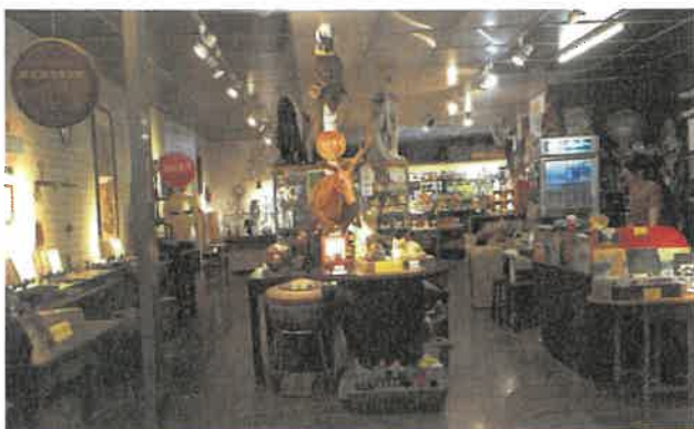
達文西瓜藝文館街角館店頭設立展覽的前後變化