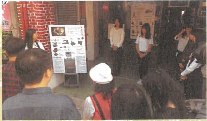
2017年「斗六舊城街角館」：勝麗西服店