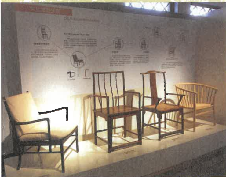
2016 年木博館「打開木視界」系列展覽

住民參與博物館事業的深淺完全取決於賦權的多寡，較淺薄的參與方式如：演講、課程或活動參與，其次是住民作為展演活動的主角，例如以住民為主的展覽或是在地專業者作為課程講師。要完成前述住民參與方式，亦需要與在地有深厚的默契，也必須獲得住民的信任。但嚴格來說，這樣就夠了嗎？是否仍缺乏住民為主體的參與機制。木博館透過住民共同策展；教育推廣活動的協力舉辦；博物館事業融入店頭與住家等，讓民眾擁有在地研究並詮釋地方的權利，如此的展演活動內涵可深度融入街區、產業、家族與個人的歷史。當然賦權住民若越多，館所必須肩負的責任也就越重，面對缺乏博物館專業的住民，如何借重其在地知識與社會網絡並作為博物館發展資本，將是館所賦權在地住民的成敗關鍵。