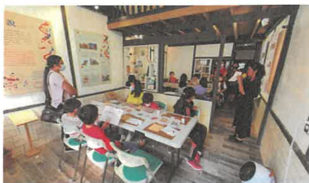
2020年「南門壹陸」舊屋力傳統工藝體驗活動