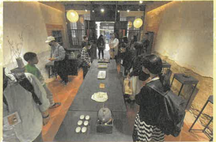
蘭室街角館保存傳統建築並調查呂鷹揚與呂鐵州歷史

本博物館藉由街角館計畫，讓民眾得以研究自身家族、產業甚至個人史，館方藉此串聯大溪歷史的常設展與社區小歷史。街角館成立前兩三年期間，先著重於自身歷史的研究，透過長期陪伴與密集的培力課程，讓住民得以透過文物的盤點進行現地典藏以及文史研究。相較於一般博物館經常委託專業團隊進入社區調查，再由博物館詮釋地方知識，住民欠缺在地詮釋的主體性。相對地曾有街角館的館長表示執行此計畫最讓住民著迷之處，在於可研究自身家族歷史並妥善典藏，再透過展演來推廣至社會大眾。有別於大部分的博物館，即便委託在地團隊進行調查研究，絕大部分是研究他人的歷史，如此將無法長久推廣並永續經營。換