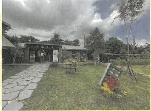
2021年康莊休閒農業區內新加入的綠合農場街角館