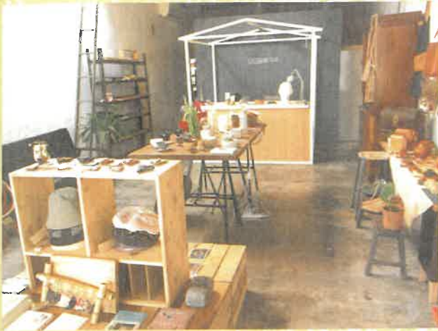
日日田街角館展演在地文化