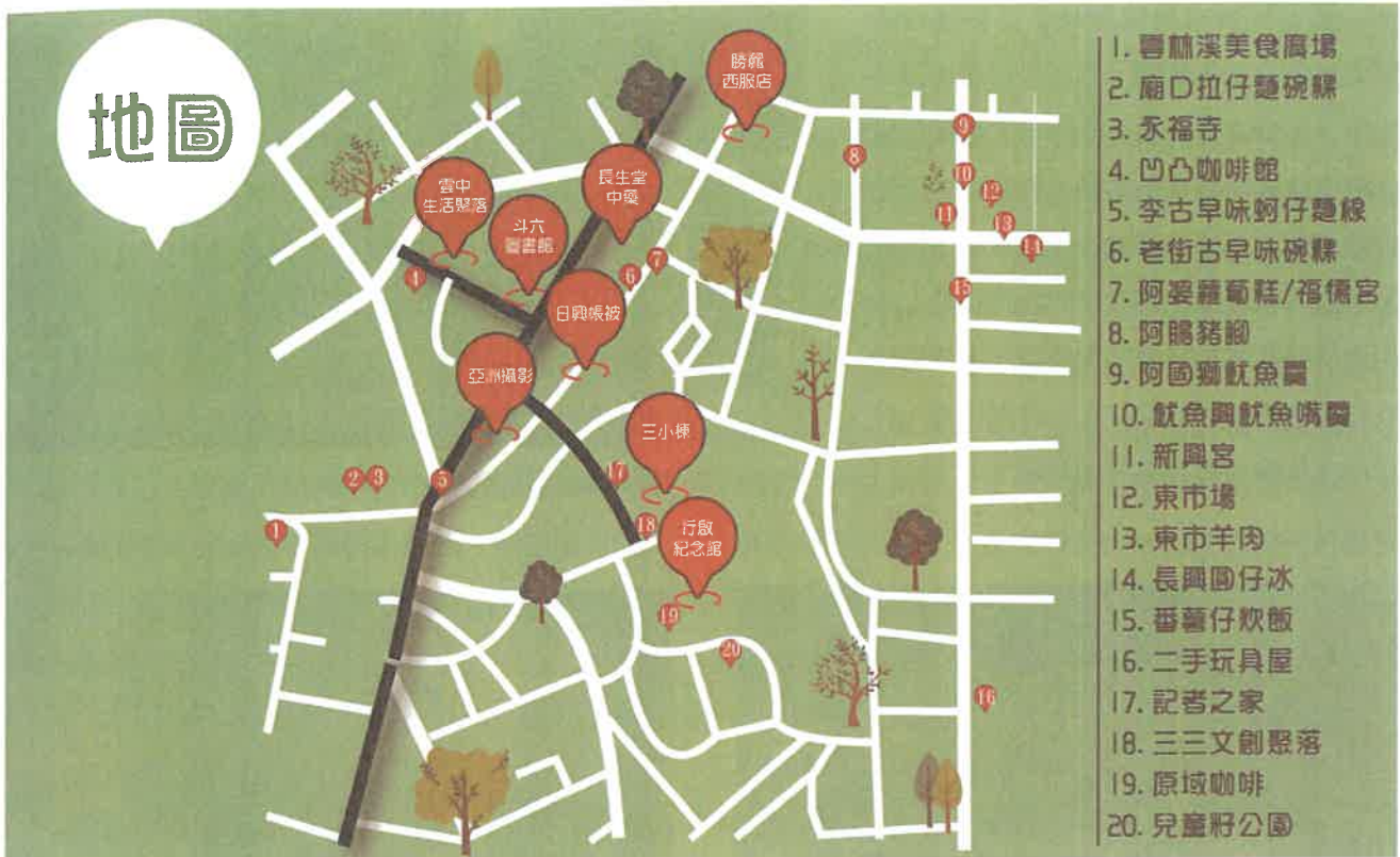
2017年「斗六舊城街角館」活動據點