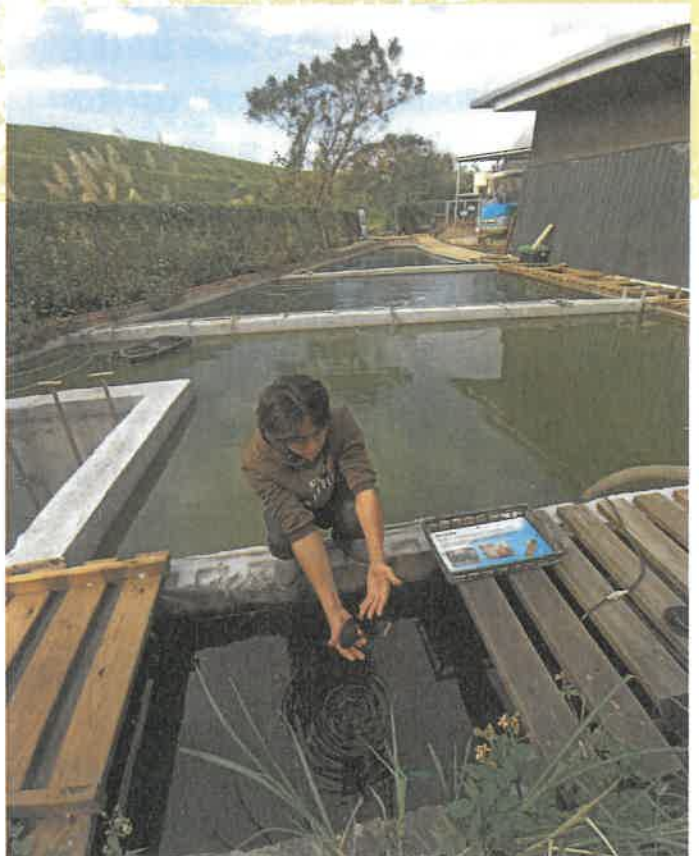
香草野園街角館致力於環境教育與友善農園的建構

言之，市民參與博物館的研究與典藏時，應儘量從其個人或社區的歷史著手，讓住民有詮釋自身歷史與價值的機會，再以現地典藏強化文物的場所精神，讓在地知識再生產出可供博物館運用的資源。